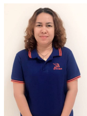
กัญทียา ประวัติ งานสารบรรณคณะแพทยศาสตร์